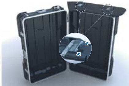
2. Placez le dessus du comptoir sur la partie à droite. Assurez-vous que le comptoir est bien installé.