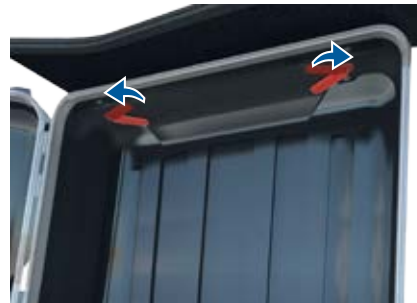
3. Barrez le comptoir en place en tournant de 1/4" les poignées rouges à l'intérieur.