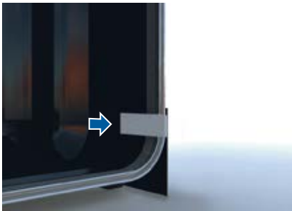
5. Fixez la bande noire au bas avec les bandes de velcro à l'intérieur.