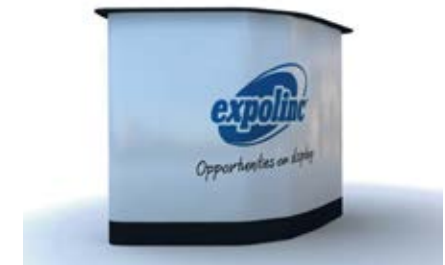
8. Le comptoir est prêt à être utilisé.