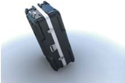
1. Ouvrir le caisson et sortir les pièces.