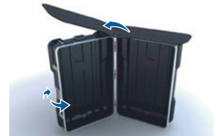
4. Dépliez le dessus du comptoir et ajustez l'angle du caisson. Ensuite, barrez en tournant les poignées rouges.