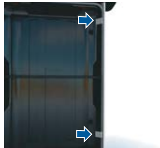
6. Fixez le visuel pour l'habillage du comptoir avec les bandes de velcro à l'intérieur.