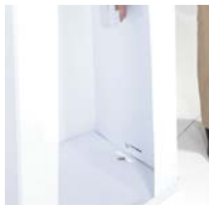
5. Continuez avec l'autre côté.