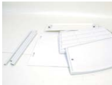
1. Séparez les pièces