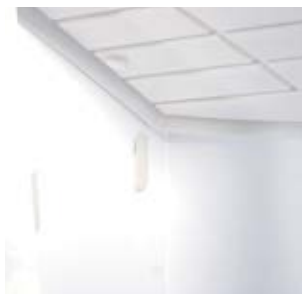
6. Placez le milieu de la base dans les crochets à l'intérieur des panneaux de côtés.