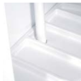
10. Laissez les pôles se placer au milieu des trous de la tablette du centre.