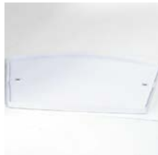
2. Placez la base du comptoir face contre-terre.