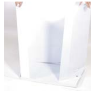
3. Alignez et insérez les côtés du comptoir sur la base.