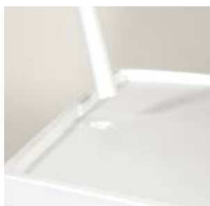
9. Insérez les pôles dans les trous du dessus de comptoir.