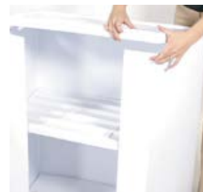
7. Assemblez le dessus du comptoir dans les panneaux de côtés. (voir étape 4)