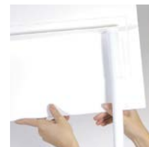
11. Placez l'entête sur les pôles.