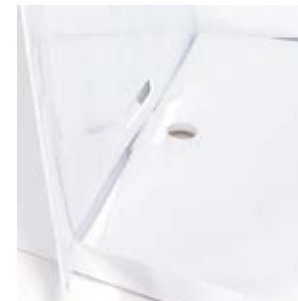
4. Insérez correctement un côté dans la fente.